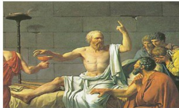
Sócrates, um dos maiores filósofos gregos.