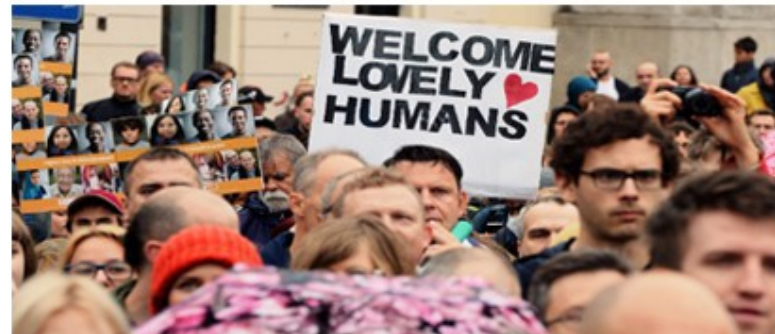
Manifestantes pró-imigração mostram o cartaz "Bem-vindo, humanos amáveis" em Varsóvia, na Polónia. http://imguol.com/c/noticias/89/2015/09/12/12set2015---manifestantes-pro-imigracao-mostram-o-cartaz-bem-vindo-humanos-amaveis-em-varsovia-na-polonia-como-uma-resposta-a-um-ato-de-direita-contra-os-imigrantes-realizado-ao-mesmo-tempo-a-1442095782873_615x300.jpg

"estamos aqui para que a nossa voz chegue ao governo e para que a decisão de acolher os muçumanos seja abandonada."