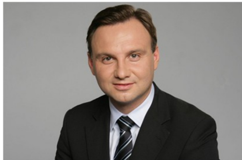
Andrzej Sebastian Duda, presidente da Polônia. Está empenhado em solucionar a crise demográfica da Polônia. http://www.fakt.pl/m/crop/1200/0/faktonline/635554839517046948.jpg

" Não é uma tarefa fácil, uma vez que na Polônia os salários são muito baixos e quase não dispomos de auxílios sociais.