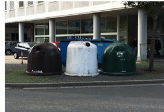
Lixeiras para vidros na Alemanha. http://3.bp.blogspot.com/-zW_0PMZ2AsY/UalrNw85OTI/AAAAAADs/tD-pvehj0o/s320/IMG_0768.JPG