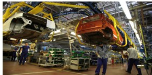
Trabalhadores numa linha de montagem do Fiat Panda, na fábrica de Tychy, Polónia. http://www.voxeurop.eu/files/images/article/fiat-tychy.jpg

Dentre os problemas causados por esse tipo de crescimento se destaca a busca por qualificação profissional que acarreta a um indivíduo o dever de estar acima das exigências estabelecidas. Além disso, não se enquadrar em qualquer área do mercado gera outra problemática o aumento do desemprego. É de extrema importância a manutenção da faixa economicamente ativa de uma população uma vez que esta é responsável pelo aumento socioeconômico de um país. Qualquer nação que se preocupa com sua economia, deve investir em tal manutenção por meio de políticas públicas que foquem no auxílio ao indivíduo que dela faz parte. Atribuindo ao país a característica de estabilidade da faixa econômica e um mercado eficiente.