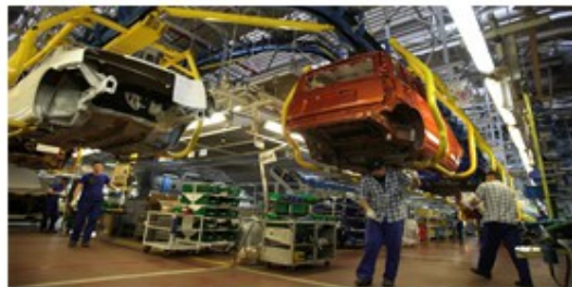
Trabalhadores numa linha de montagem do Fiat Panda, na fábrica de Tychy, Polónia.

Dentre os problemas causados por esse tipo de crescimento se destaca a busca por qualificação profissional que acarreta a um individuo o dever de estar acima das exigências estabelecidas. Além disso, não se enquadrar em qualquer área do mercado gera outra problemática o aumento do desemprego. É de extrema importância a manutenção da faixa economicamente ativa de uma população uma vez que esta é responsável pelo aumento socioeconômico de um país. Qualquer nação que se preocupa com sua economia, deve investir em tal manutenção por meio de políticas publicas que foquem no auxilio ao individuo que dela faz parte. Atribuindo ao país a característica de estabilidade da faixa econômica e um mercado eficiente.