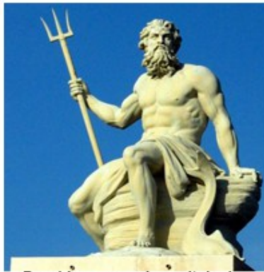
Poseidon, segundo a mitologia grega, deus da água.

A partir da educação ateniense e espartana era um povo que valorizava muito o conhecimento, tanto que os meninos eram ensinados a questionar os mistérios do mundo, esse conhecimento era passado até para as meninas através de suas mães que valorizavam que fossem adultas cultas mesmo com a sociedade extremamente machista da época e os soldados não eram treinados somente com o físico, mas com estratégias também.