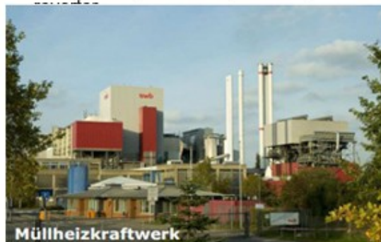
Usina de queima de lixo de Bremen, Alemanha.

Contudo, é interessante os países desenvolvidos se empenharem para alcançar o mesmo estágio de desenvolvimento na reciclagem que a Alemanha alcançou, pois isso significa menos lixo nos lixões, menos solos poluídos e menos lençóis subterrâneos contaminados. Sem deixar de ser lucrativo, porque o lixo deixará de ser visto como um problema, tornando-se uma fonte de renda.